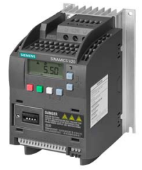
Figura similar Figure similar

Referencia : 6SL3210-5BE21-1UV0 Article No. :