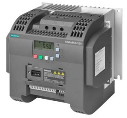
Figura similar Figure similar

Referencia : 6SL3210-5BE25-5UV0 Article No. :