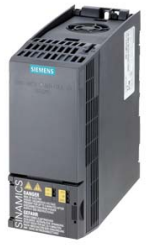
Figura similar Figure similar

Referencia : 6SL3210-1KE14-3UB2 Article No. :