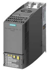
Figura similar Figure similar

Referencia : 6SL3210-1KE17-5UB1 Article No. :